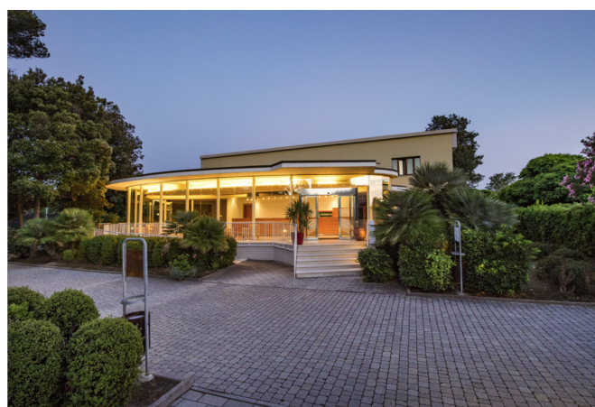
Centro Congressi Oleandro