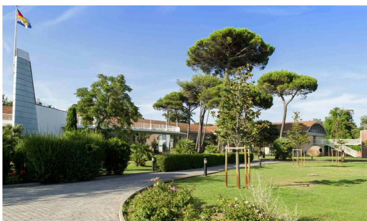
Green Park Resort